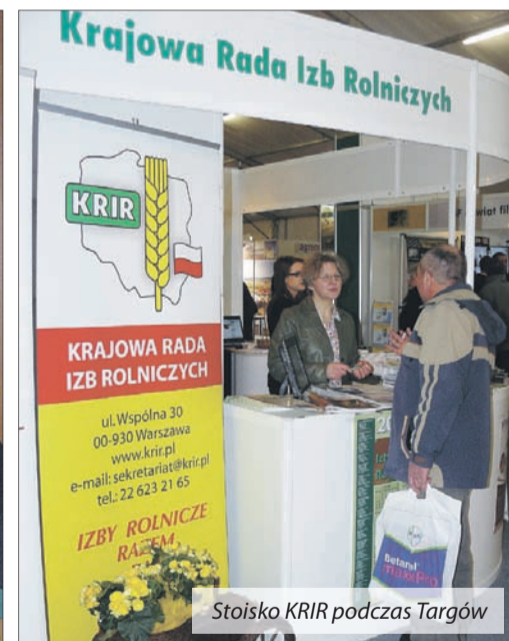
Stoisko KRIR podczas Targów

Czasopismo Krajowej Rady Izby Rolniczych Ukazuje się raz w miesiącu.