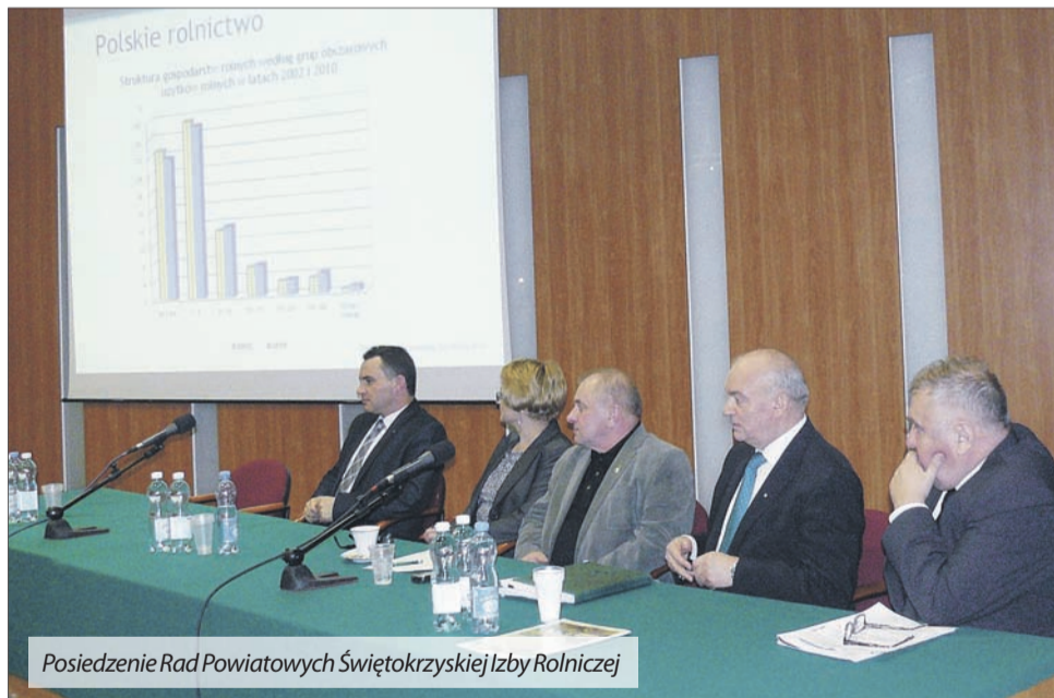
Posiedzenie Rad Powiatowych Świętokrzyskiej Izby Rolniczej

Kolejnym wydarzeniem towarzyszącym Targom była konferencja organizowana przez Ministerstwo Rolnictwa i Rozwoju Wsi we współpracy z Targami Kielce, Agencją Rynku Rolnego oraz Instytutem Technologiczno-Przy-