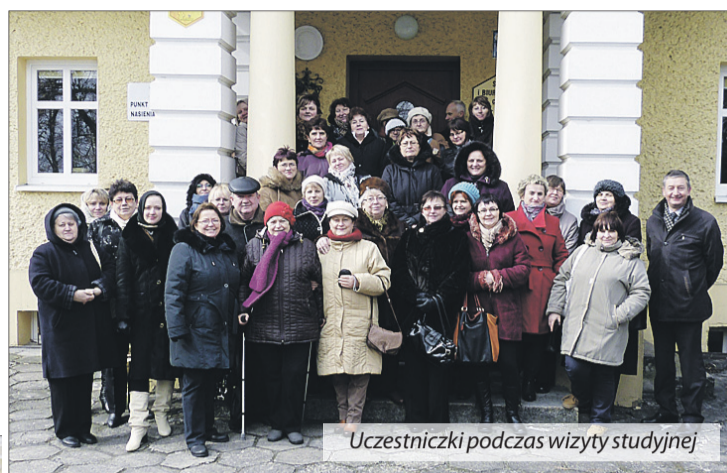
Uczestniczki podczas wizyty studyjnej

Następnie głos zabrał naczelnik Wydziału Kontroli z kluczoborskiego